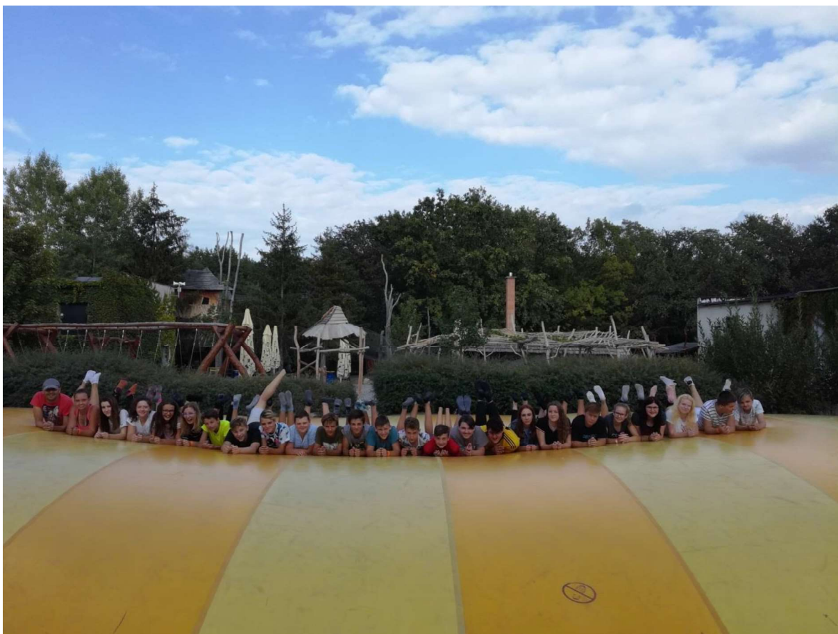
výlet – 9. třída